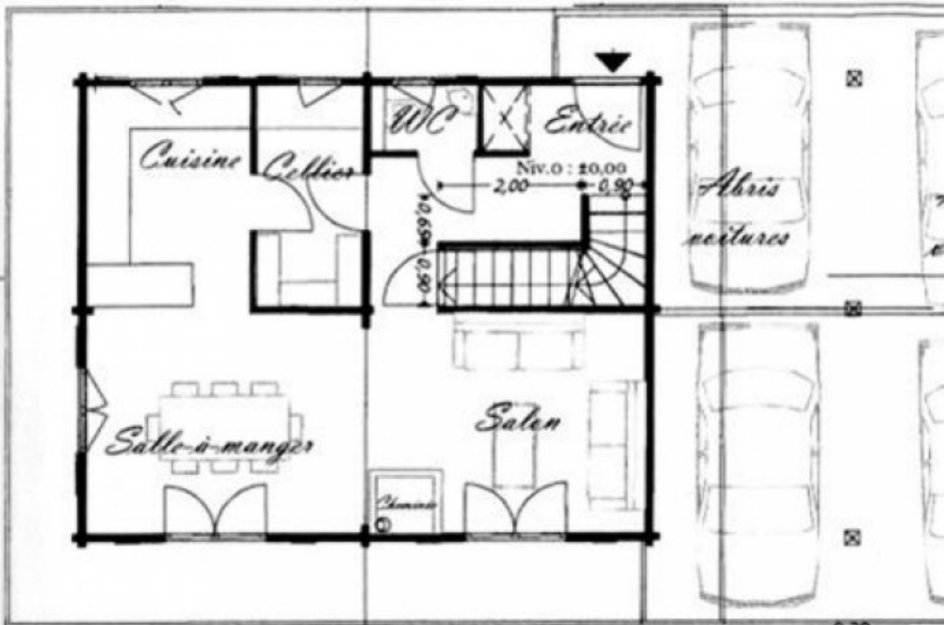
Chalet D, ground floor, not to scale