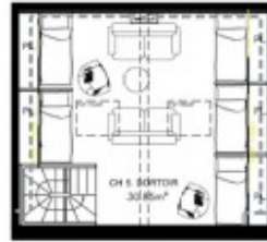
PLAN T5 - R+4