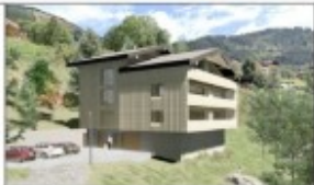
LES BALCONS DE LA BECHIGNE