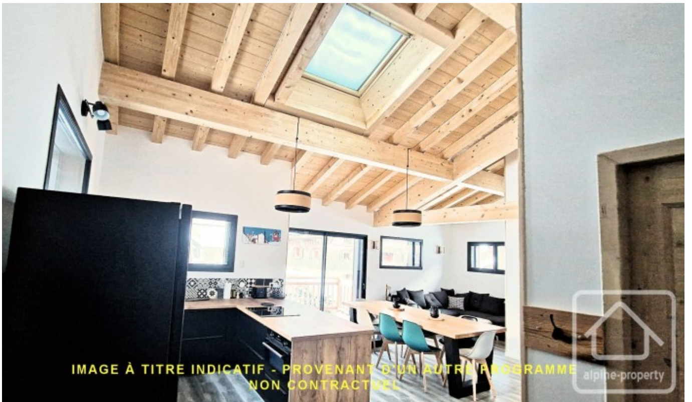
IMAGE À TITRE INDICATIF - PROVENANT D'UN AUTRE PROGRAMME. NON CONTRACTUEL