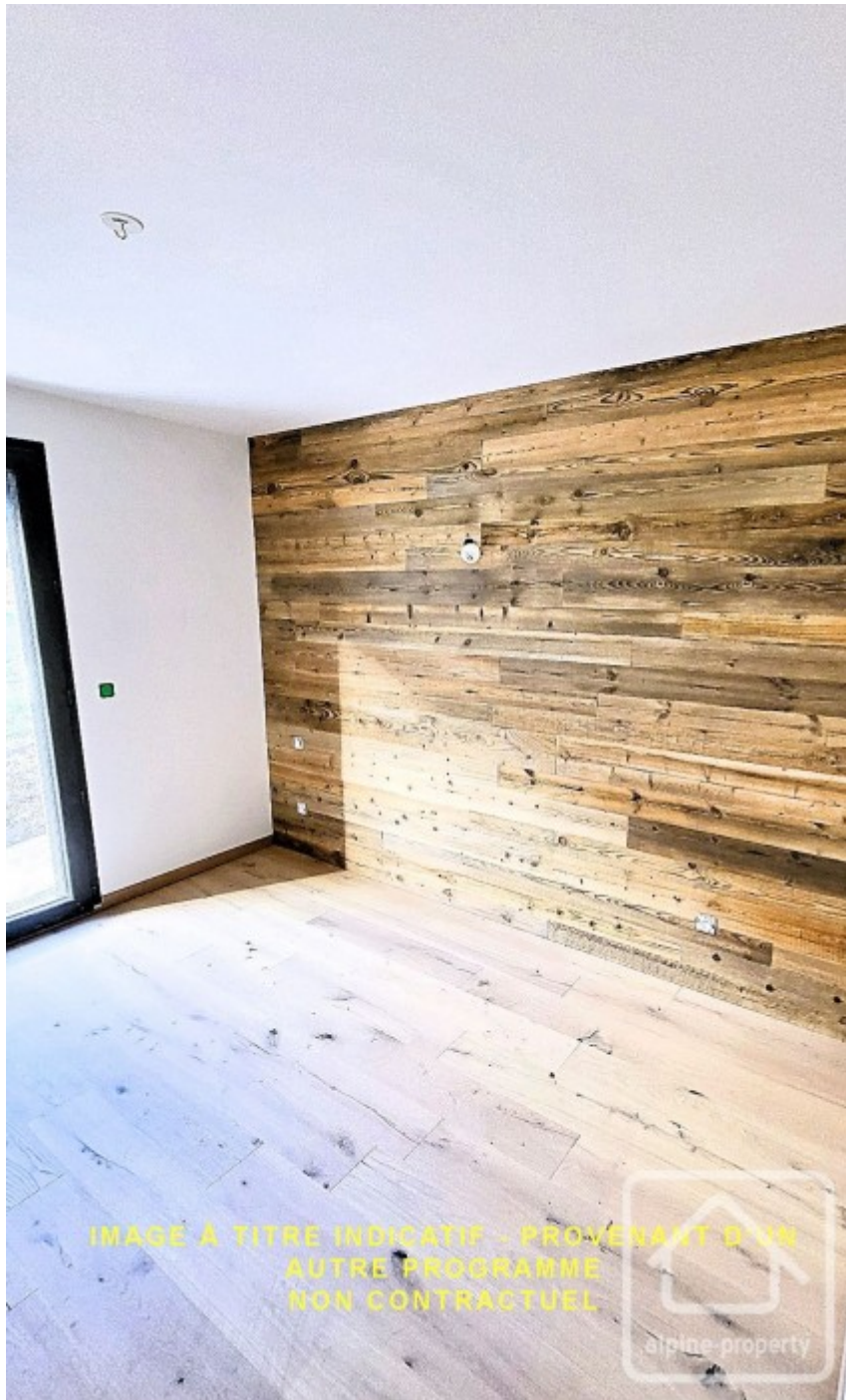
IMAGE A TITRE INDICATIF - PROVENANT D'UN AUTRE PROGRAMME NON CONTRACTUEL