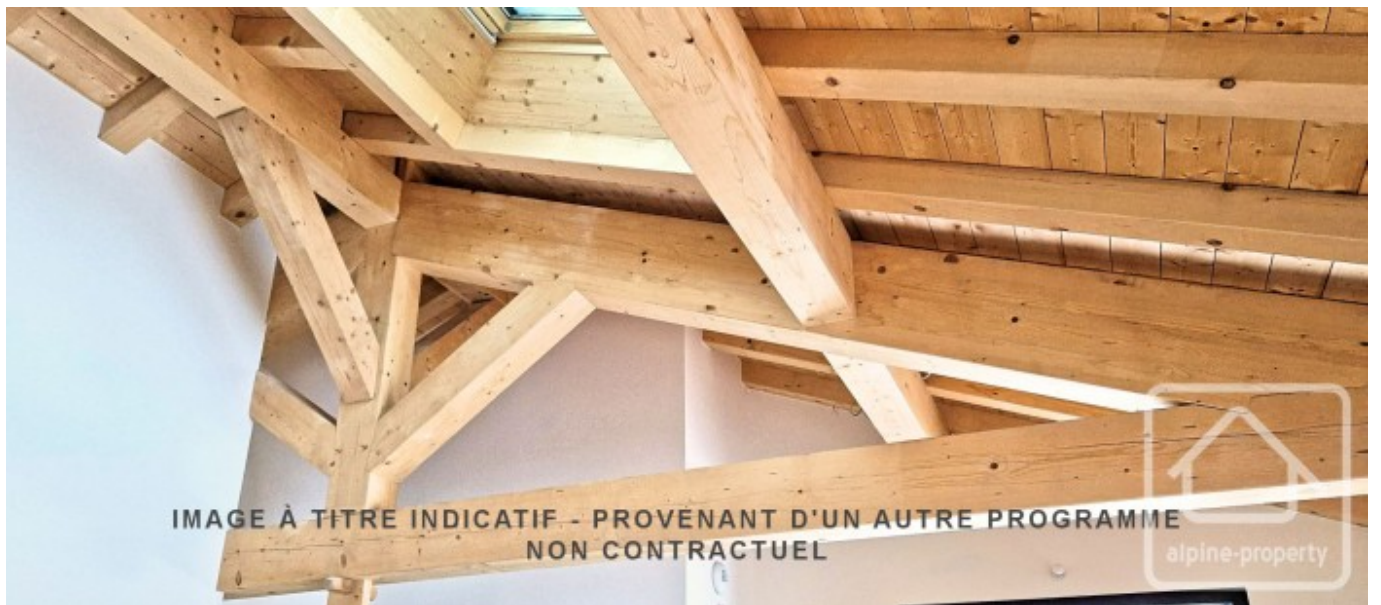
IMAGE À TITRE INDICATIF - PROVENANT D'UN AUTRE PROGRAMME NON CONTRACTUEL