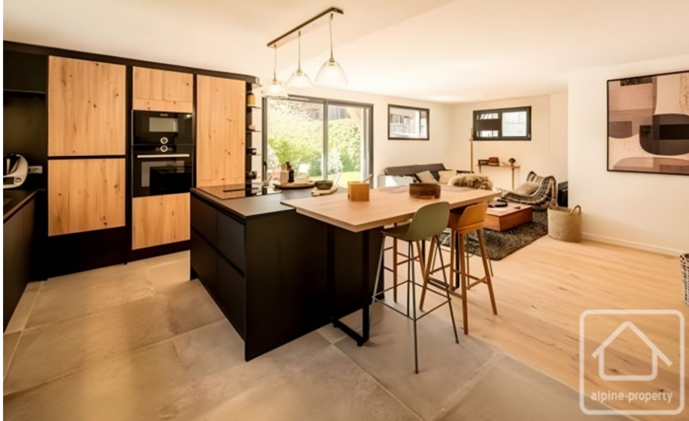
IMAGE À TITRE INDICATIF - PROVENANT D'UN AUTRE PROGRAMME. NON CONTRACTUEL.