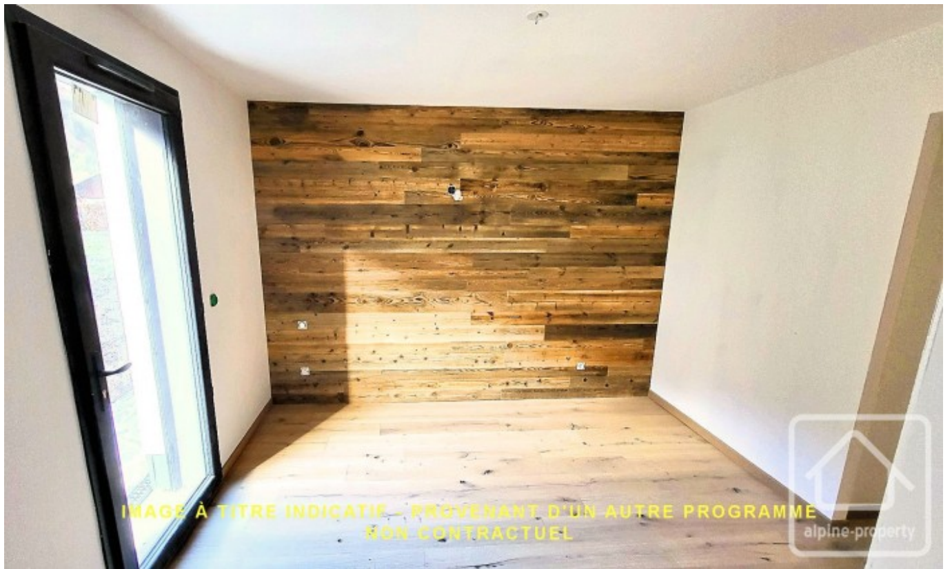
IMAGE À TITRE INDICATIF - PROVENANT D'UN AUTRE PROGRAMME NON CONTRACTUEL