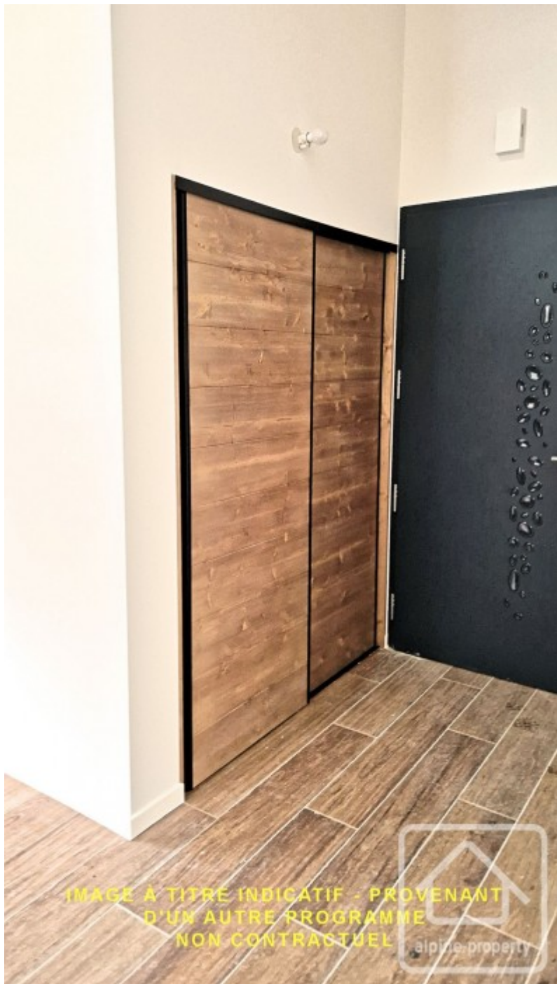
IMAGE A TITRE INDICATIF - PROVENANT D'UN AUTRE PROGRAMME NON CONTRACTUEL