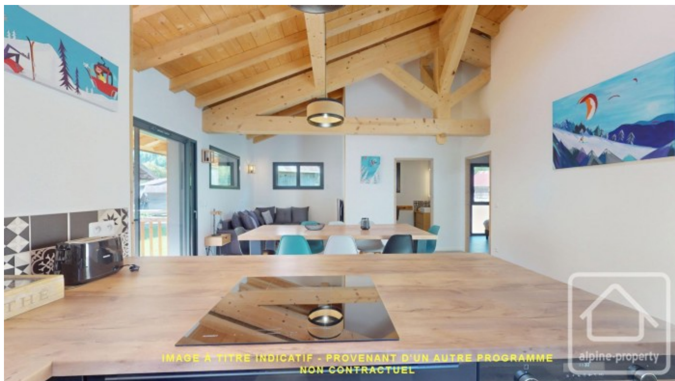
IMAGE A TITRE INDICATIF - PROVENANT D'UN AUTRE PROGRAMME NON CONTRACTUEL