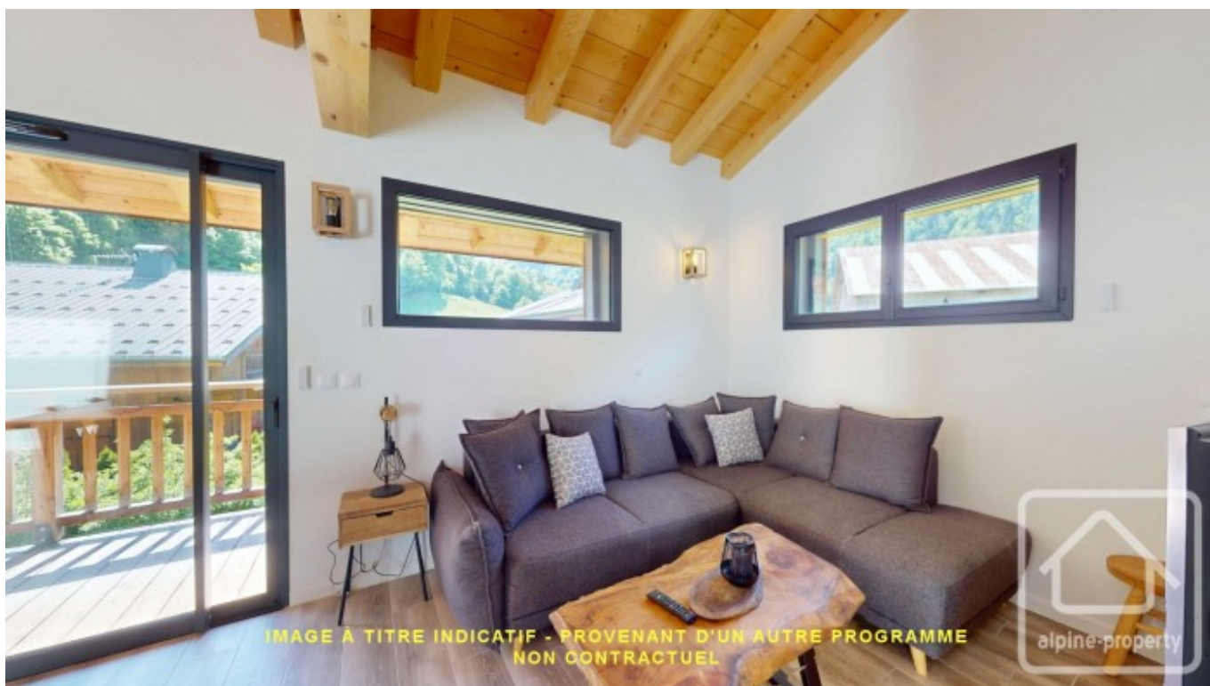
IMAGE À TITRE INDICATIF - PROVENANT D'UN AUTRE PROGRAMME NON CONTRACTUEL