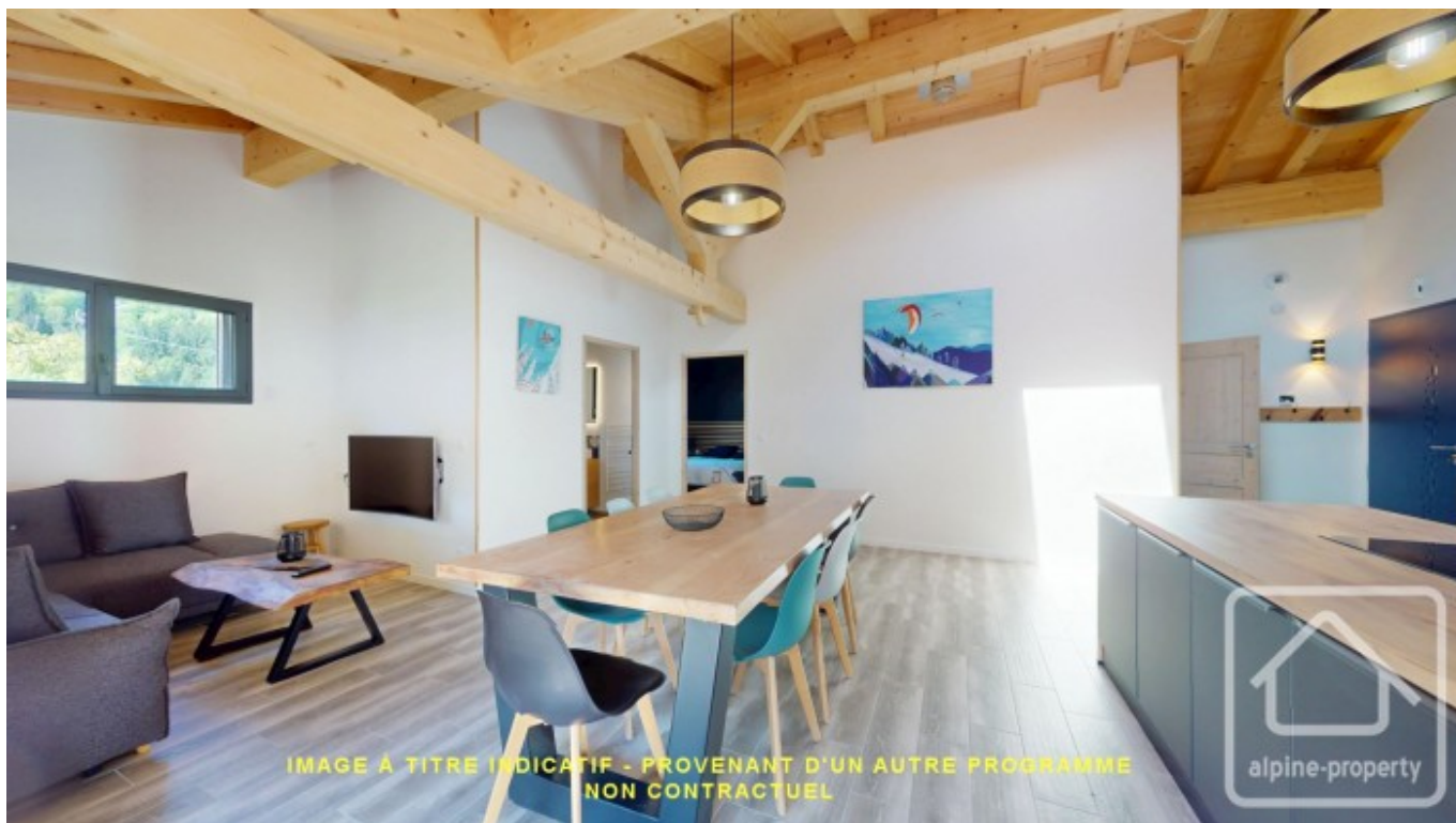
IMAGE À TITRE INDICATIF - PROVENANT D'UN AUTRE PROGRAMME NON CONTRACTUEL