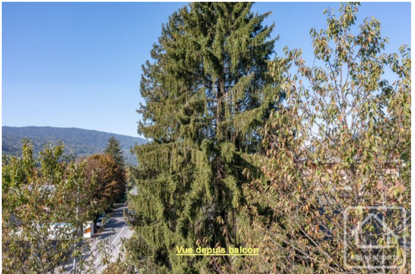
Vue depuis balcon