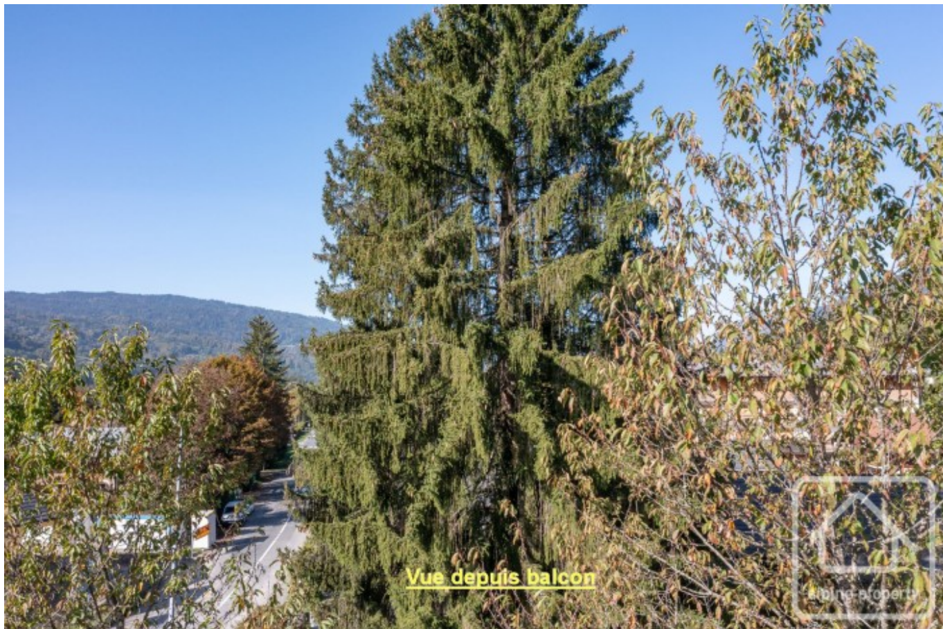
Vue depuis balcon