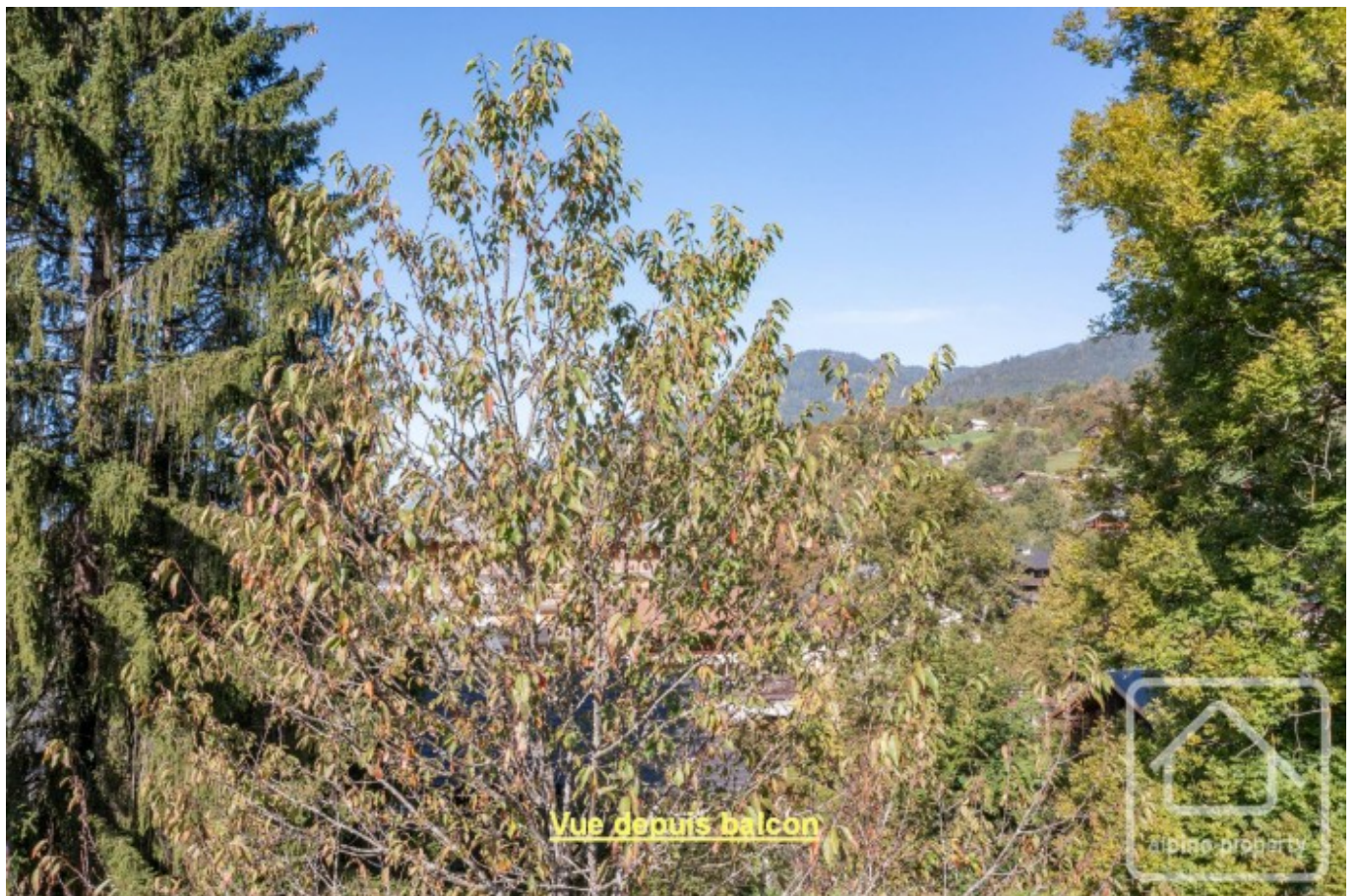
Vue depuis balcon