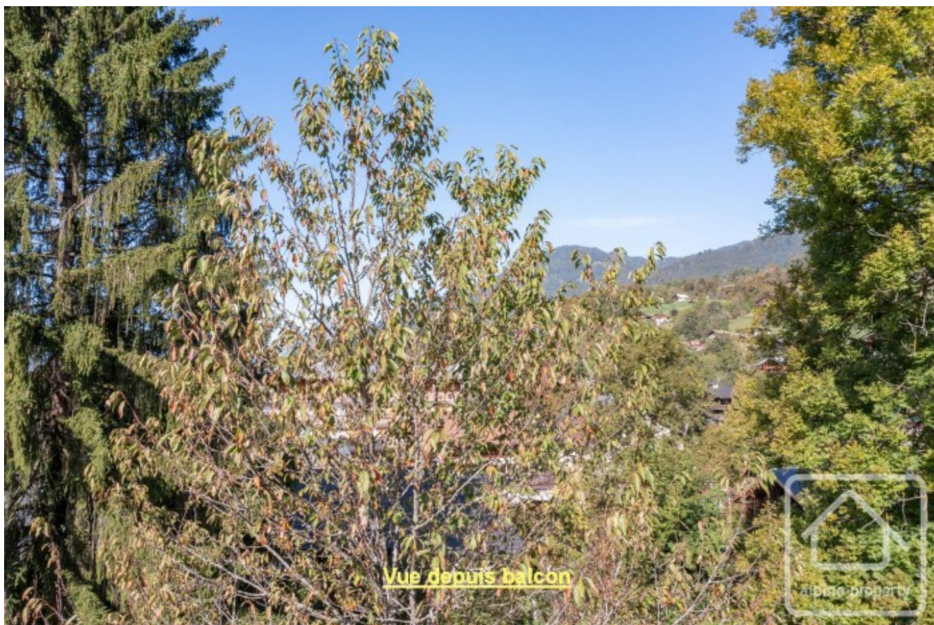
Vue depuis balcon