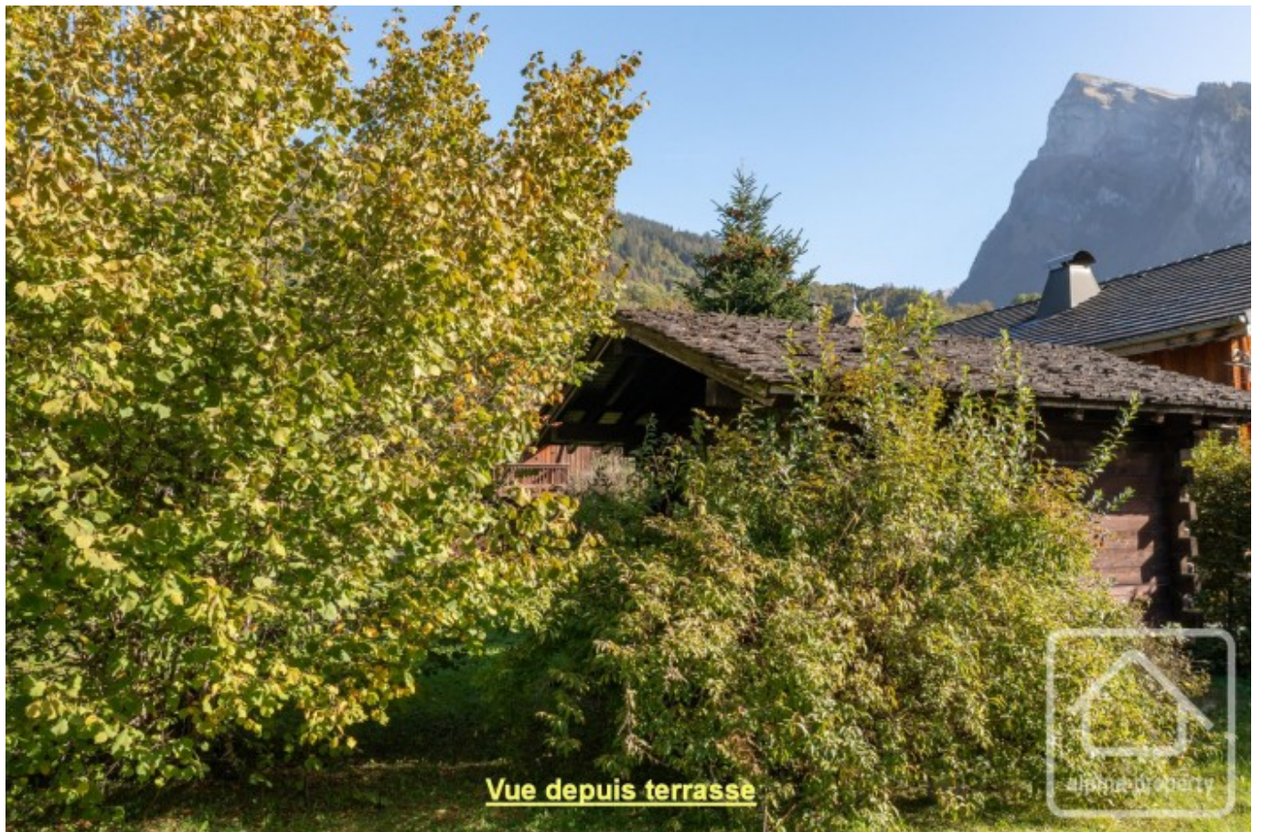
Vue depuis terrasse