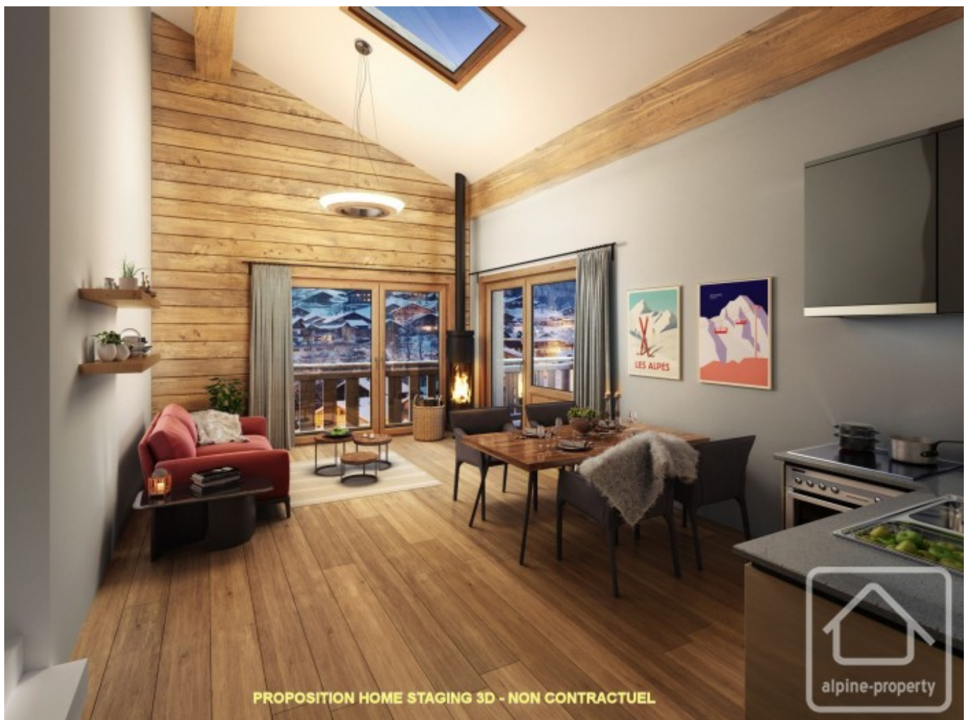
PROPOSITION HOME STAGING 3D - NON CONTRACTUEL