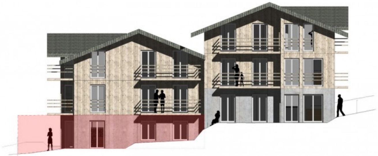
APPARTEMENT 1 REZ DE JARDIN EST - FAÇADE NORD