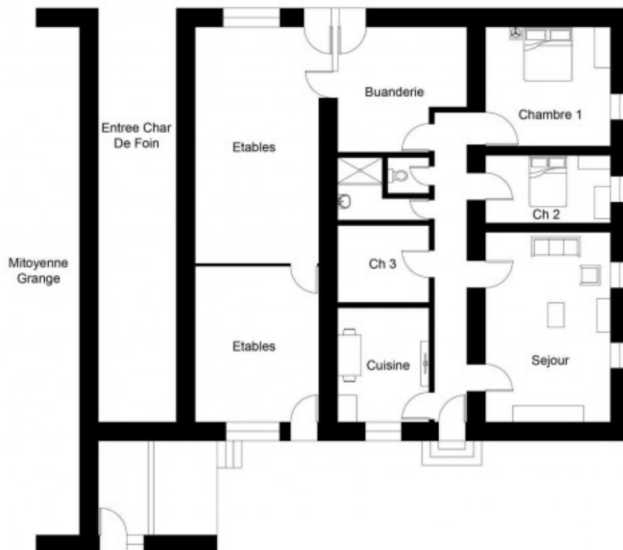
PLAN D'ÉTAGE INFÉRIEUR